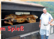
Ochsen vom Spieß