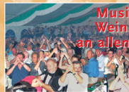
Musik & Tanz & Wein & Fassbier an allen vier Tagen