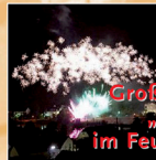
Großfeuerwerk „Die Mosel im Feuerzauber“